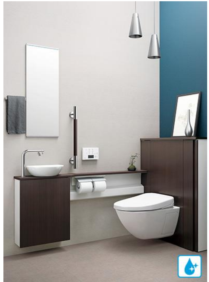
全てが浮いているトイレ

休日に出かけて一番憂鬱なのが女性トイレの行列です。女性トイレの数をもっと増やしてほしい、いつも思っていました。その思いが受け止められて、政府は昨年5月25日、女性が暮らしやすい空間づくりの「象徴」として、快適なトイレを増やす国民的な運動「ジャパン・トイレ・チャレンジ」を始める方針を固めました。やった！女性用トイレ増設などによる「待ち時間の男女均等化」を打ち出し、官民のトイレ管理者に整備や運用での配慮を促すものです。「暮らしの質」向上検討会は「すべての女性が輝く政策」の一環として設置されました。提言には災害時のトイレに関するガイドライン作りや温水洗浄便座などの国際規格を策定し、日本の高機能トイレを海外へ普及、拡大し、成長戦略につなげる案も盛り込まれました。右は全てが浮いているトイレです。素晴らしい！お掃除がとても楽です。区内施設でも女性トイレをもっと増やす努力をしてまいります。